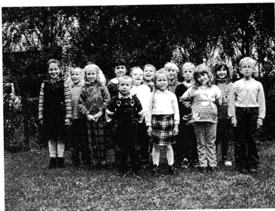
La classe des petits (Parution de la photo de la classe des grands dans le prochain numéro)