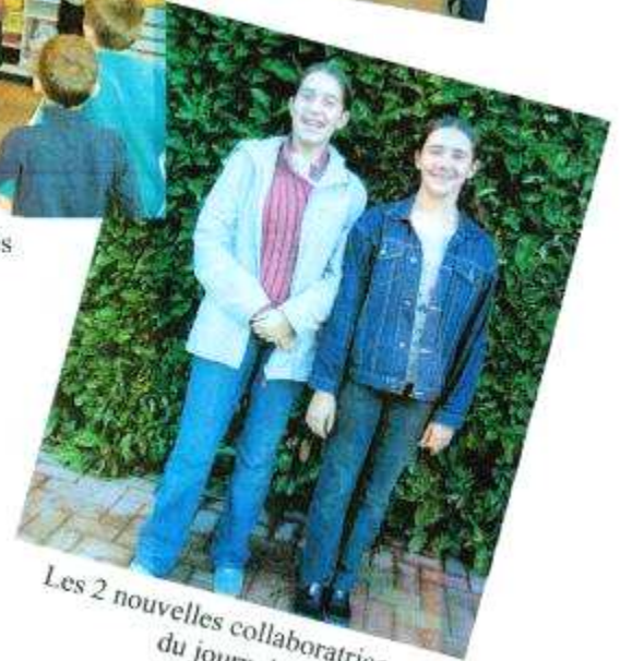
Les 2 nouvelles collaboratrices du journal