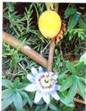
Fleur et fruit de la passion

Vous avez une passion, n'hésitez pas à nous contacter afin de la faire partager et, si vous le souhaitez, vous pourrez paraître dans un prochain journal.