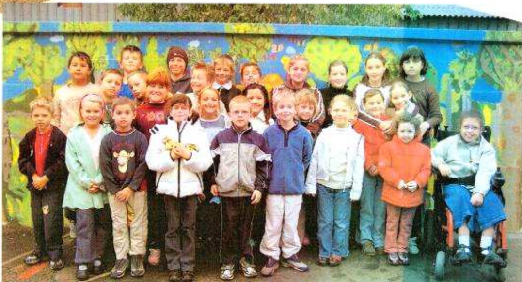
Les enfants de l'école