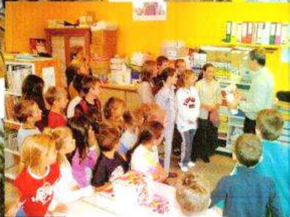
Remise des dictionnaires