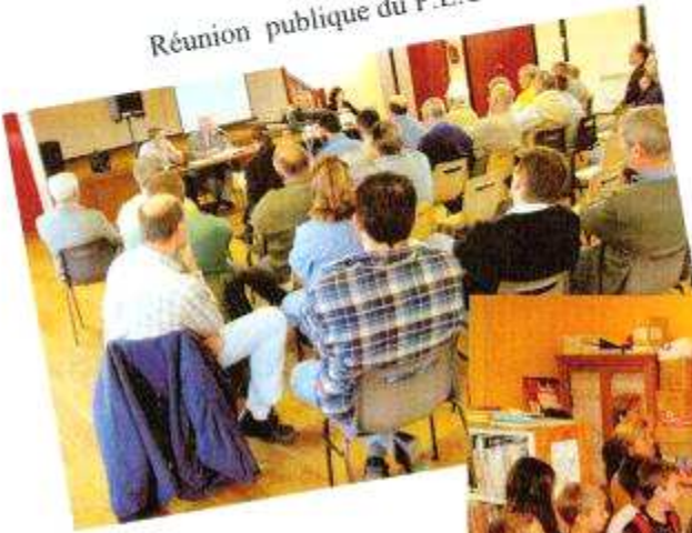
Réunion publique du P.L.U.