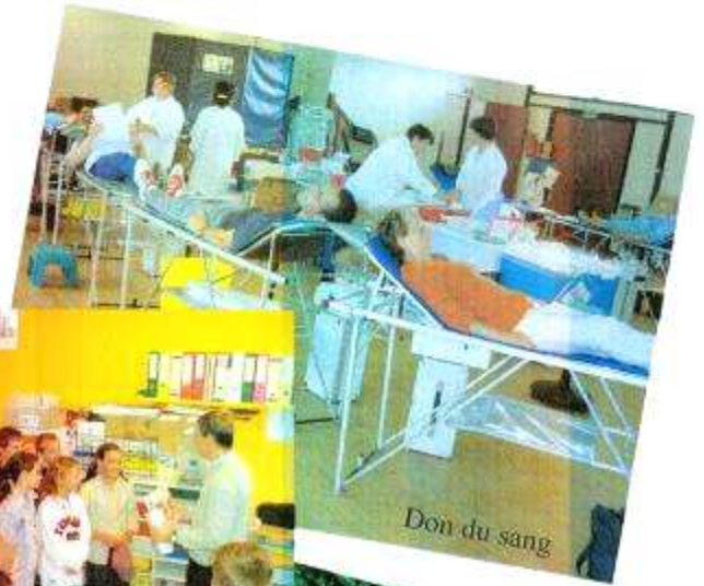
Don du sang