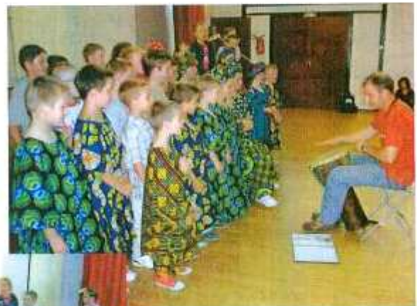
Fête de l'école