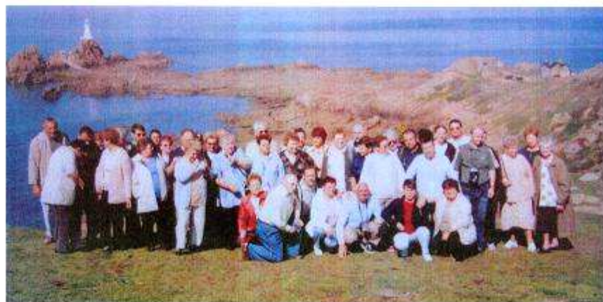
Photo du groupe de Martot au cours d'un arrêt sur l'île de JERSEY.

Retour au port de St Hélier pour la destination de St Malo. Toujours à bord d'un catamaran, nous effectuons la traversée inverse sur une mer calme et avec le beau temps.