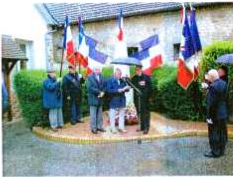
Cérémonie du 8 mai