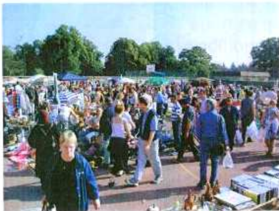
Foire à tout