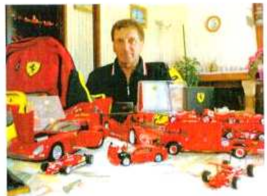
Le collectionneur du trimestre

L'équipe de la rédaction de votre journal vous souhaite de très bonnes vacances